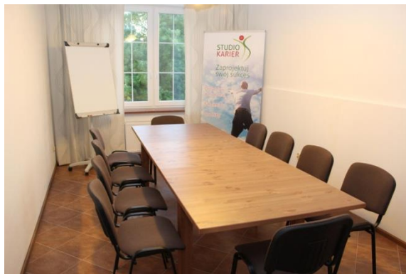
Sala szkoleniowa 15 m

Do Państwa dyspozycji oddajemy dwie nowoczesne, w pełni wyposażone sale szkoleniowe do wynajęcia w systemie godzinowym lub całodziennym. Polecamy do wykorzystania na spotkania biznesowe, imprezy i przyjęcia okolicznościowe. W zależności od charakteru spotkania do 30- 40 osób. W salach dostępny jest internet, pełne wyposażenie prezentacyjne i zaplecze kuchenne.