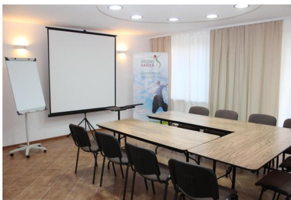
Sala szkoleniowa 40m